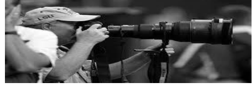
الشكل (٣) الكاميرا (سكاي هوك).