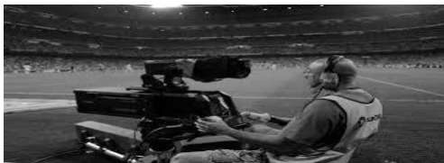
شكل (٢). الكاميرا (سكاي هوك).

من اللاعبين أو الجماهير ويعتبرون كبش الفداء لفشل الفرق وعليهم تقع مسؤولية الهزائم للفرق المتنافسة.