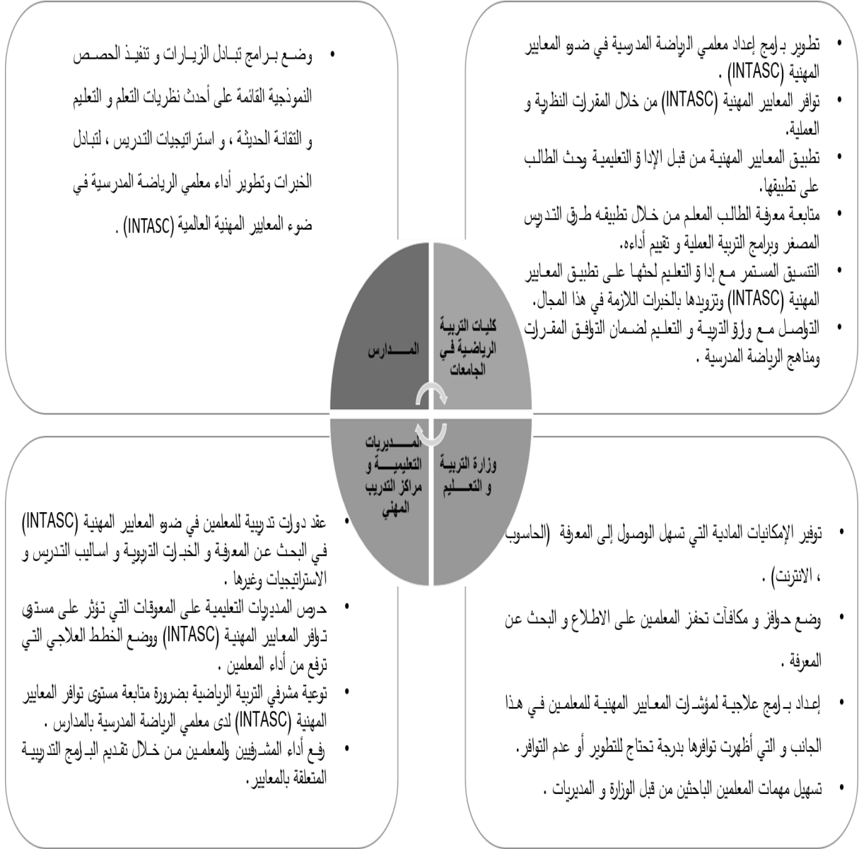
شكل (٢). المعرفة بالمحتوى وتطبيقه والتخطيط للتدريس واستراتيجيات التدريس.

ويمكن المساهمة في تطوير أداء معلمي الرياضة المدرسية في هذا المحور من خلال ما يأتي: