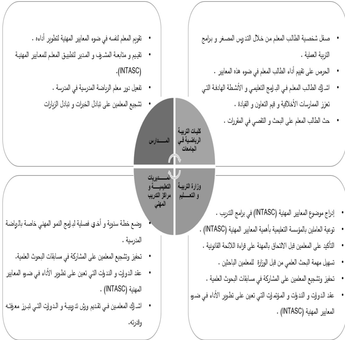
شكل (٤). التعلم المهني والأخلاقيات المهنية والتعاون والقيادة.

ويمكن المساهمة في تطوير أداء معلمي الرياضة المدرسية في هذا المحور من خلال ما يأتي: