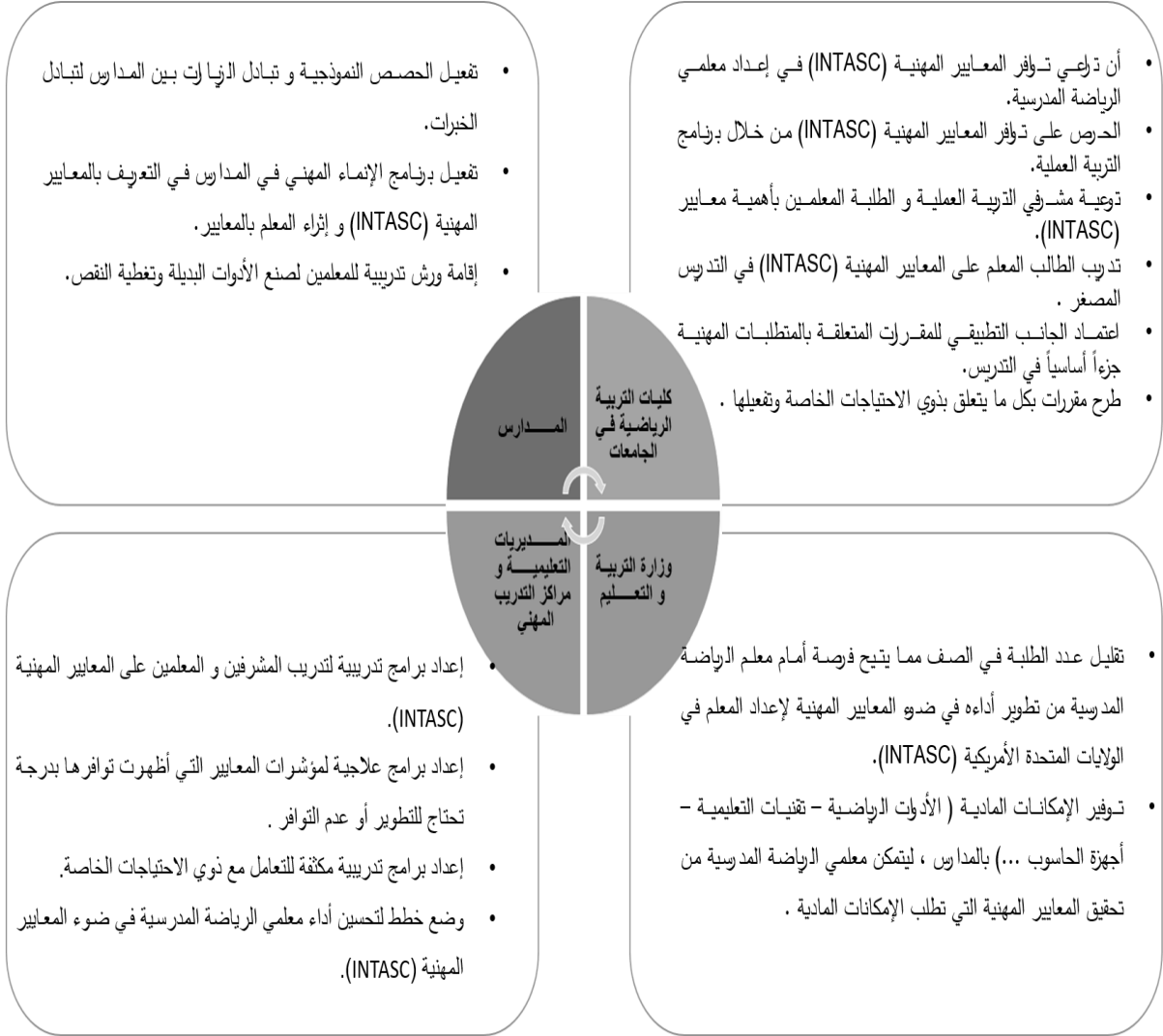
شكل (١). تطوير المتعلم وفروق التعلم والبيئة التعليمية.

ويمكن المساهمة في تطوير أداء معلمي الرياضة المدرسية في هذا المحور من خلال ما يأتي: