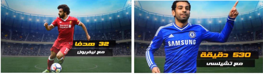
شكل رقم (١٦). صور الديكوية مع الخلفية الثابتة.

عرض الشرائح المصورة مع الخلفية الموسيقية الثابتة على طول العرض لخلق السياق العام للحدث، كذلك وظفت الخرائط الثابتة لربط الأحداث بالمكان اعتمدت أيضًا على النصوص القصيرة التي توضح تفاصيل الحدث وأستخدمت الخلفية كعنصر إبراز للنصوص المستخدمة في الفيديو جراف.