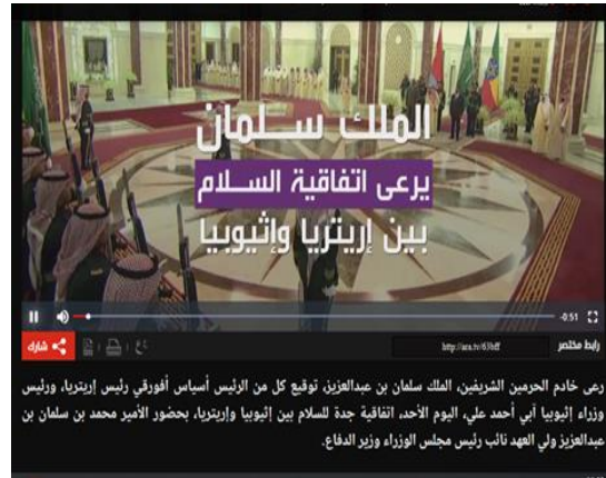
الشكل رقم (١٤). استخدام الخلفية كعامل إبراز.