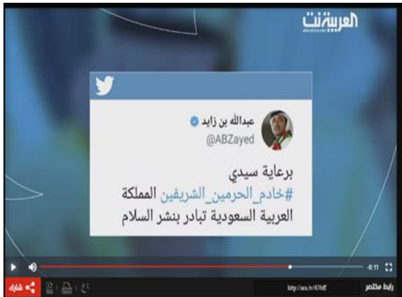
الشكل رقم (١٥). عنصر جرافيك " لقطة شاشة ".

خلفية تتناسب وطبيعة الحدث، وأستخدمت النصوص القصيرة ووظف في بعضها عناصر إبراز النص بوضع خلفية ملونة لبعض الكلمات التي تمثل أسماء لشخصيات الحدث والأماكن المرتبطة به في محاكاة لفكرة النص الفائت، والذي يجري تمييزه بلون مختلف (https://www.alarabiya.net، ٢٠١٨) انظر الشكل رقم (١٤) والشكل رقم (٥).