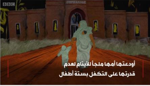
الشكل رقم (٨). يوضح استخدام نصوص قصيرة دون توظيف لعوامل الإبراز.

الجرافيك لتكوين رسوم تعبيرية لمعلومات تخص الشخصية، جرى توظيف التأثيرات البصرية لإعطاء معاني الحزن والمأساة التي عاشتها شخصية الحدث، استخدمت النصوص القصيرة دون تطبيق لعوامل الإبراز مثل (اللون - الحجم) واكتفى الفيديو جراف بتوظيف مقطع موسيقي من أشهر أغانيها كموسيقي