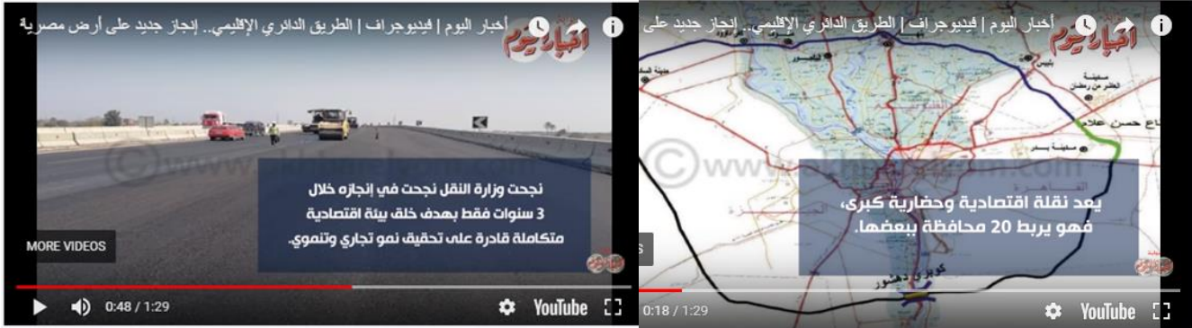
شكل رقم (١٧). استخدام الخلفية للنصوص القصيرة.

على صفحة موقعها الإلكتروني نشرت أخبار اليوم بشكل إلحاق خبرًا بأسلوب الفيديو جراف تحت عنوان " الطريق الدائري الإقليمي.. إنجاز جديد على أرض مصرية "، بوصفه إضافة لنص الخبر الأصلي، ولإعطاء القارئ المزيد من التفاصيل حول الحدث، مدة الخبر ١:٢٩ دقيقة، وظفت بشكل أساسي أسلوب