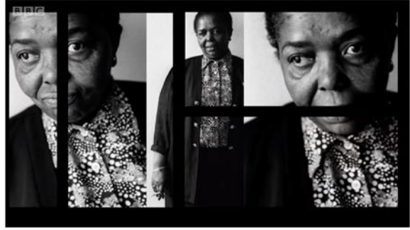
الشكل رقم (٧). يوضح التأثيرات البصرية في موقع BBC.

من الباحث على ما سبق من صور خاصة بالحفرية المكتشفة، استخدمت النصوص القصيرة لسرد تفاصيل الاكتشاف وإعطاء خلفية معلوماتية عن الحدث، جرى تطبيق الحركة بشكل أساسي على النصوص دون تطبيق لأي عامل من عوامل الإبراز، واعتمدت في التنقل بين الشرائح المصورة على التصفح التلقائي استخدمت المؤثرات البصرية للجمع بين نوعين من الوسائط في الإطار نفسه، حيث جرى تجزئته إلى قسمين: قسم يعرض لقطة فيديو، والجزء