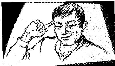
Image B (mettre le doigt sur le côté de la tête) pour exprimer l'idée que celui-ci est fou

Ce geste a été interprété également par l'ensemble de notre public. Grosso modo, ce sont des gestes reconnus sur le plan international par un très grand nombre de gens de culture et de langues différentes, si bien qu'on peut les qualifier "d'internationaux." Donc, perception unifiée du sens par des gens de cultures variés. Ce sont des gestes à caractère universel (ou quasi-universel). Ils seraient décodés par un très grand nombre de personnes. Ils font partie de leur univers propre.