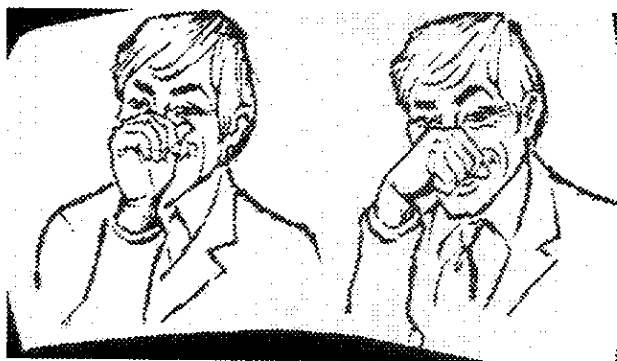
Image A : mettre le poignet fermé devant le nez et le faire tourner.

Pour un français ce geste signifie bien évidemment que la personne désignée est ivre.