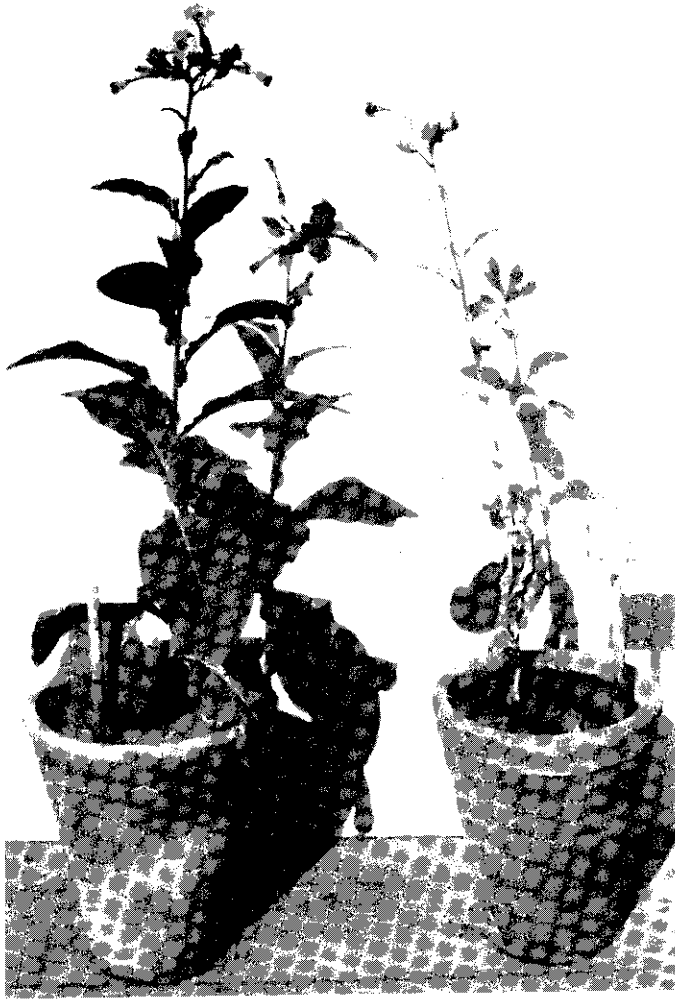
شكل ١ . تأثير العدوى الصناعية لنباتات تبغ صنف Coker-347 بالفطر F. solani في البيت الزجاجي (٢٥-٣٠م°)