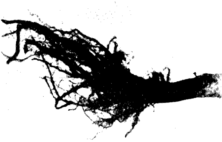
شكل ٣ . تأثير الفطر R. solani على جذور التبغ صنف Golsoor