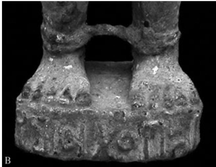
الشكل (٤). قاعدة التمثال السابق عليها اسم الأسير.

Schiettecatte, J., Une collection de statuettes, p.188.