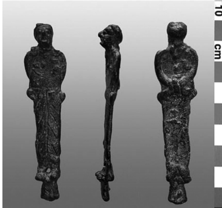
الشكل (١). تقييد اليدين من عند الرسغين خلف الظهر. Schiettecatte, J., Une collection de statuettes, p.178.