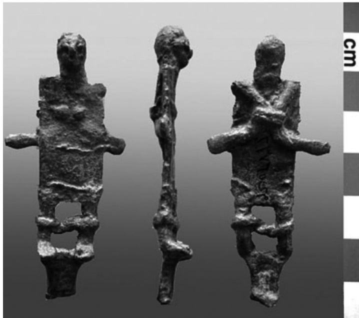
الشكل (٢). تقييد اليدين من عند الكوعين خلف الظهر. Schiettecatte, J., Une collection de statuettes, p.179.