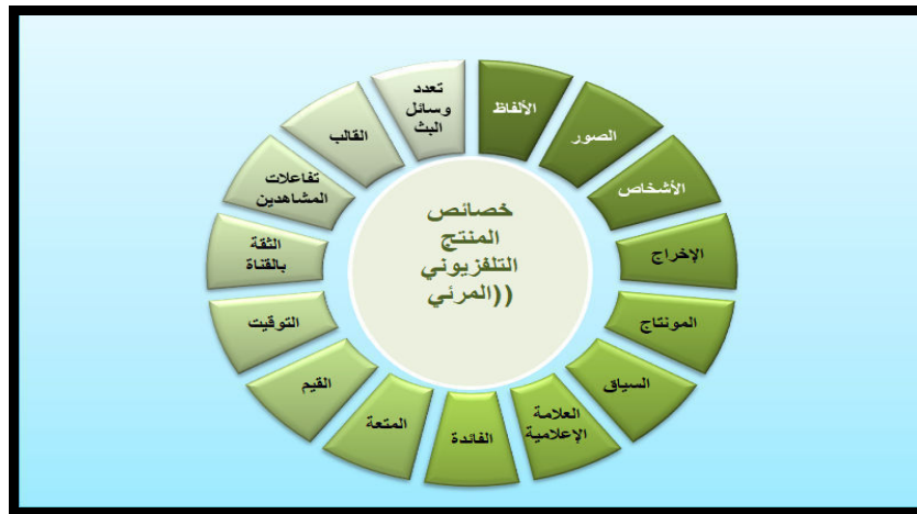
شكل رقم (7) خصائص المنتج التلفزيوني